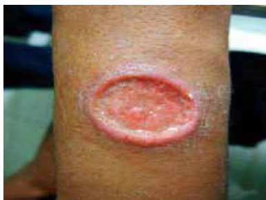
Figura 3: Lesão por leishmaniose tegumentar.

A LTA se manifesta em lesões, podendo ser ela única ou de forma difusa, espalhada em várias regiões do corpo. A mesma possui características específicas, semelhantes a úlceras, com bordas elevadas e o fundo granuloso e avermelhada (Figura 3), sendo as mesmas indolores. Por se tratar de uma lesão, a mesma torna-se uma “porta de entrada” para outros antígenos adentrarem no organismo [8].