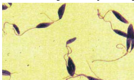
Figura2: formato flagelado ou promastigota.