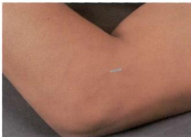
Figura 2: Localização do ponto IG-11 [10].