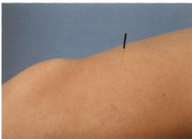
Figura 5: Localização do ponto BP-10 [10].