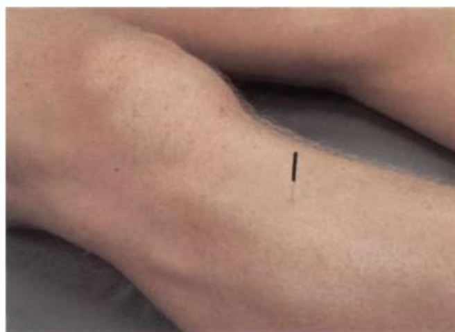
Figura 3: Localização do ponto E-36 [10].