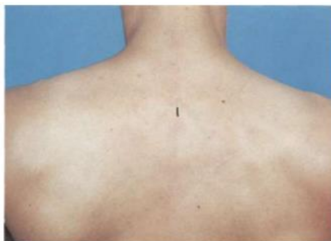
Figura 6: Localização do ponto VG-14 [10].