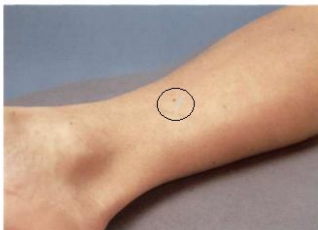
Figura 4: Localização do ponto BP-6 [10].